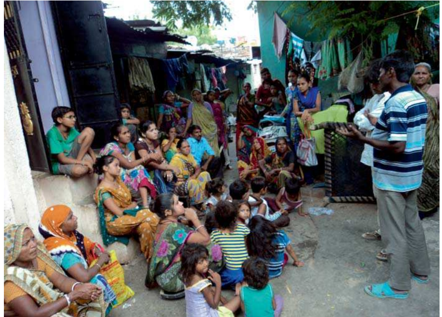
En las reuniones comunitarias participan familias al completo.

El camino recorrido por estos colectivos Valmiki supone un reto esperanzador ya que no consiste tan sólo en formar grupos de trabajo y dis-