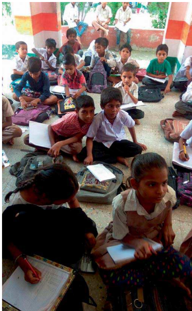
Los niños y niñas que participan en las clases de refuerzo acuden con ilusión porque saben que con cada nueva lección se abre una nueva puerta.

En India, en la actualidad, están escolarizados el 96% de menores de entre 6 y 14 años, pero casi la mitad son incapaces de comprender un texto sencillo y 6 de cada 10 no puede realizar operaciones aritméticas básicas tras pasar cinco años en la escuela. Existen numerosas razones para explicar este retraso académico como por ejemplo escasa preparación del profesorado, uso de metodologías obsoletas, clases superpobladas, absentismo escolar tanto del alumnado como del profesorado, así como ausencia total de procedimientos para trabajar con el alumnado que poco a poco se queda atrás. Así las cosas, no es de extrañar que al llegar a 5º curso de primaria más de la mitad del alumnado se encuentre muy rezagado, no sepa leer ni escribir y carezca de motivación suficiente para acudir a la escuela de manera regular.