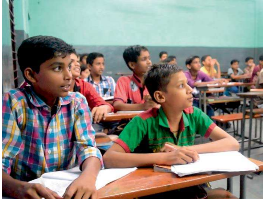
El programa de aprendizaje hace que chicos y chicas mejoren su autoestima.

Misión de Gujerat-ALBOAN ha apoyado este proyecto ya que somos cons-