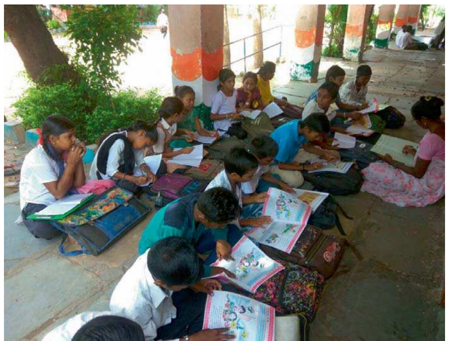
Matemáticas, ciencias sociales y naturales son algunas de las asignaturas ofrecidas para que chicos y chicas continúen su formación.