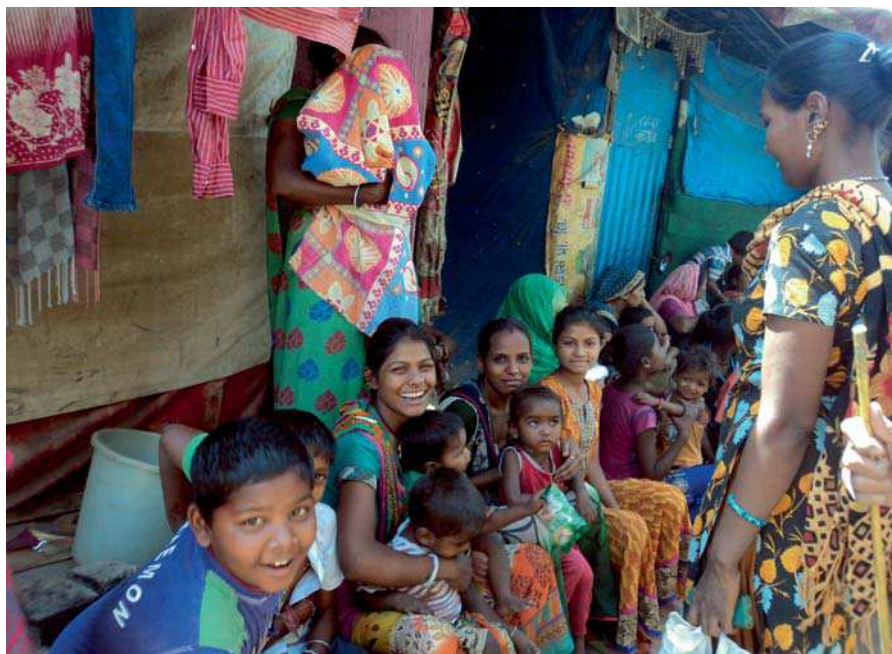
Las mujeres lideran el trabajo de la comunidad Valkimi.

Dentro del sistema de castas encontramos a la comunidad Valmiki, considerada la subcasta dalit más excluida. La práctica totalidad de este grupo se dedica al manual scavenging , es decir la recolección y limpieza manual de los desechos de origen humano, con herramientas precarias: cestos, cubos y cepillos. De su desempeño adquieren su carácter impuro. Pese a que dicha actividad fue prohibida en 1993 y ratificada en 2013, aún la comunidad se ve obligada a realizarlo, mientras los gobiernos locales miran hacia otro lado perpetuando así su situación de exclusión en diferentes esferas de la vida, ya que gran parte vive en slums, barrios marginales, por carecer de documentación de identidad que les permita acceder a bienes y servicios como educación, nutrición, salud o agua, y discriminación para participar de espacios o celebraciones. Esta situación de indocumentación, y la propia pertenencia a la comunidad, propicia que sufran violaciones de derechos humanos, situación que se ve