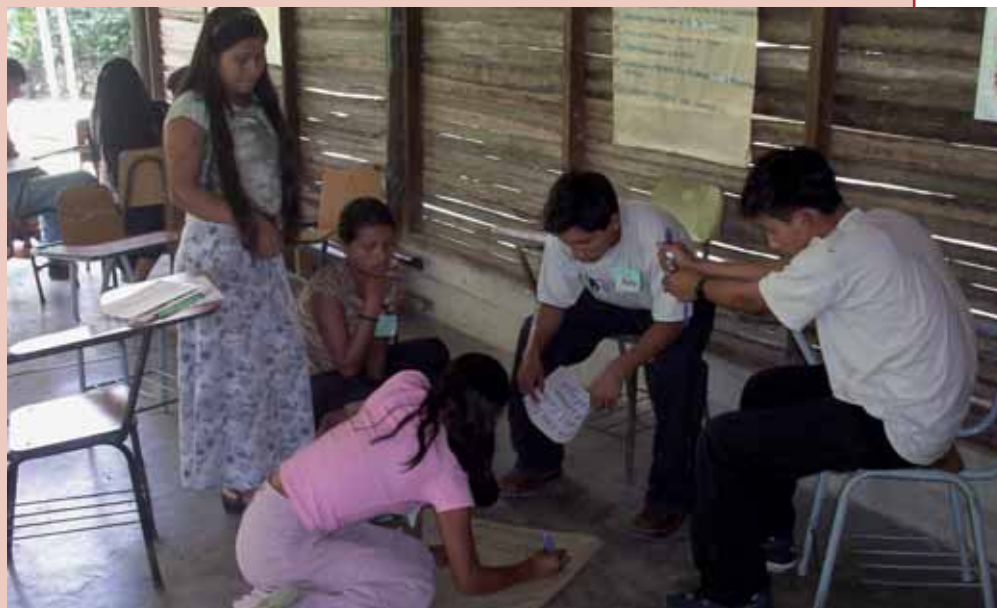
Taller con jóvenes en Perú.

Desde el apostolado social seguiremos contribuyendo al fortalecimiento de los espacios locales de participación ciudadana. Nuestro compromiso con la justicia nos acerca a la vida cotidiana de la gente en sus espacios locales de vida. Lo local es nuestro terreno más familiar. Sin embargo, hoy tenemos el reto de levantar la mirada e ir más allá de lo local y contribuir al fortalecimiento de lo regional, para incidir en lo nacional. También queremos contribuir a la formación de las personas para incidir en la esfera política institucional y no sólo para resolver problemas y necesidades sociales.