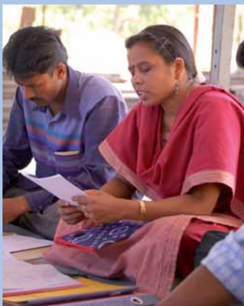
Desde las categorías del desarrollo humano, el bienestar solo puede ser fruto de la acción colectiva.

Por el contrario, desde las categorías del desarrollo humano, la construcción de una comunidad que tenga un