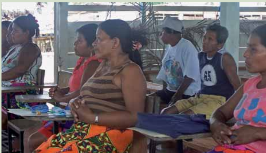
Taller en Panamá.