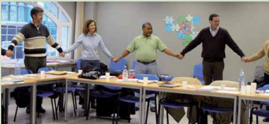
Momento del seminario "Institucionalidad y construcción de lo público con participación popular".

En los últimos años, el concepto de participación ha tenido mayor presencia en el discurso de la cooperación, vinculado a una perspectiva más política del desarrollo. Este enfoque promueve la actuación de las personas empobrecidas como sujetos activos de su propio desarrollo. Si bien la participación no se encuentra únicamente relacionada con la pobreza, se presenta como una condición indispensable para su superación.