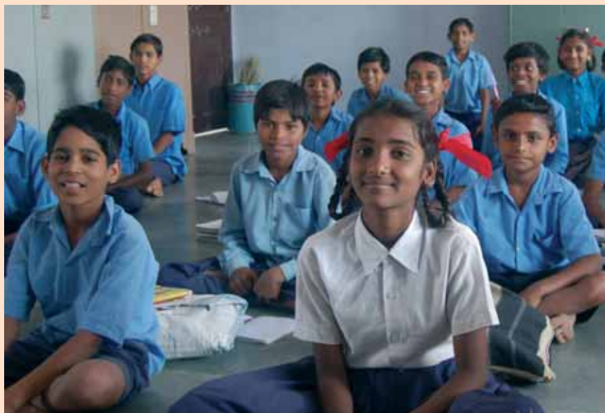
ALBOAN ha recogido el testigo de un largo camino de trabajo y dedicación.