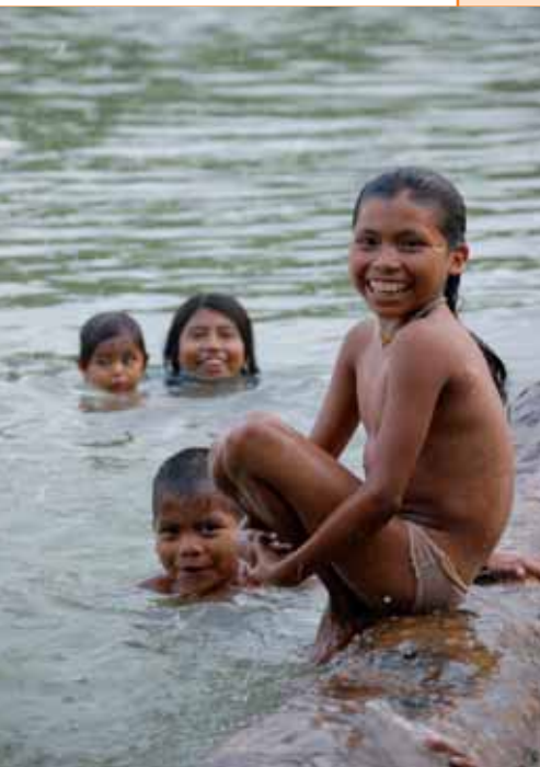
Tenemos motivos para celebrar con alegría estos 10 años.

Bihotzez eskertu nahi ditut urte hauetan gurekin lanean aritu diren pertsona eta erakunde guztiak. Pertsonalki, zirrarez beteriko denboraldia izan da, asko ikasi eta pertsona bezala hazteko balio izan didana. Erakunde mailan, zuen laguntza ezinbestekoa izan da ALBOAN bere bidean aurkitu dituen erronkei erantzun egokia emateko.