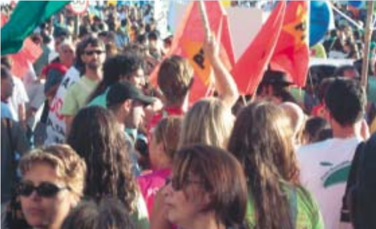
En este momento existen dentro de la Compañía de Jesús diversas redes inscritas a diferentes ámbitos

Durante la 34ª Congregación General, celebrada en 1995, se propuso impulsar la creación de redes como un “marco para el desarrollo de diversas formas de cooperación global y regional”. Esta declaración expresaba la urgencia de desarrollar el carácter internacional de la Compañía de Jesús en un mundo que ya estaba experimentando los efectos de la globalización. El trabajo en red es visto como un medio para dar respuestas globales y/o multidisciplinares a cuestiones relevantes en el ámbito local pero que no se entienden ni pueden ser afrontadas sin el análisis y la incidencia en el ámbito global.