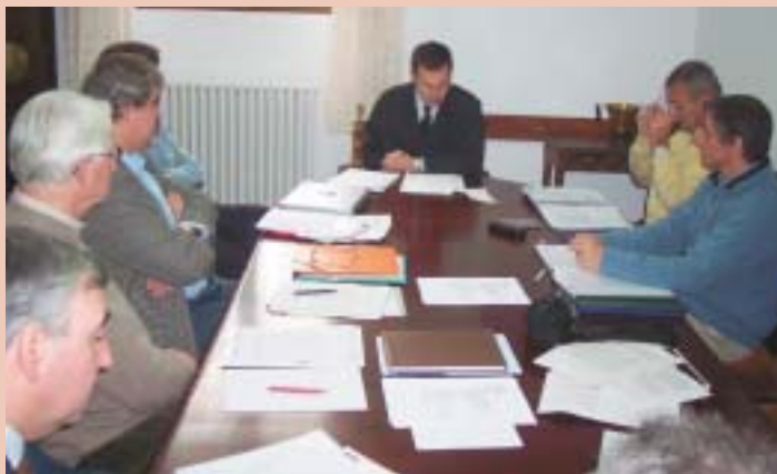
El trabajo en red nos permite realizar acciones que de manera individual sería difícil conseguir.

La Red Xavier, constituida formalmente el pasado 3 de diciembre en Javier, está actualmente integrada por seis ONG de cooperación al desarrollo ligadas a la Compañía de Jesús y pertenecientes a diferentes países europeos (dos de Portugal, dos de España, una de Italia y otra de Alemania). Somos organizaciones con diferentes experiencias, conocimientos y recursos, que compartimos un convencimiento común: juntas somos capaces de realizar acciones que nuestras organizaciones de forma individual difícilmente podrían conseguir (tanto en el Norte como en el Sur).