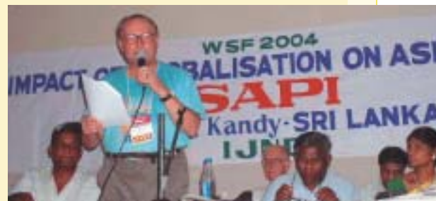
SAPI ekimenak Indiaren muga geografikoak gainditu eta Asiako Hegoaldeko Jesuiten beste hainbat erakundeekin elkarlanean aritzeko aukera berriak zabaltzeko.

Horrez gain, iazko abenduaren 26ko gertaeren aurrean, SAPI, JESA eta ISIk lehenengo dei koordinatua egin zuten, Asiako Hego-ekialdeko zein Iparraldeko lankide diren erakundeekin (hauen artean ALBOAN ) ahaleginak batzeko eta gure ekimenak modu egokiagoan bideratzeko. □