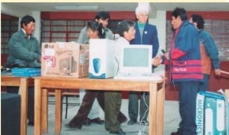
Mediante el trabajo en Red se ha estimulado la construcción colectiva y revisión permanente de la Propuesta de Educación Popular y Promoción Social del Movimiento.

El 5 de marzo de 1955 se iniciaron las clases de la primera escuela de Fe y Alegría en una barriada marginal del oeste de Caracas (Venezuela). Un albañil del barrio llamado Abraham Reyes se enteró que el jesuita José María Vélaz y un pequeño grupo de universitarios andaban buscando un lugar para la escuela, y cedió su propia vivienda para acoger a los niños y niñas de la zona. Con este generoso gesto nació Fe y Alegría , un movimiento que cinco décadas después se extiende por 16 países de América Latina, y es reflejo fiel de una de las afirmaciones que dejó escritas su Fundador: “Nos hemos atrevido a levantar una bandera cuando tantos arrian y desdennan las banderas. Nuestra bandera ha sido la educación integral de los más pobres, es decir, de los más menospreciados, y como estos son muchos millones, nos hemos atrevido a la educación de millones. O lo que es lo mismo: a la liberación de millones” .