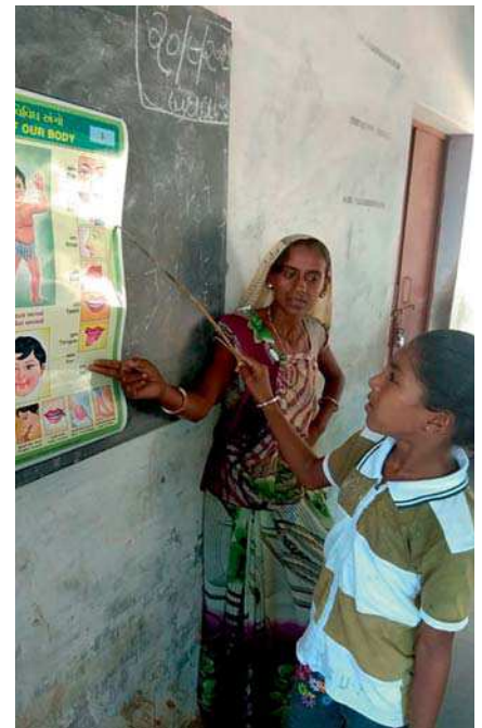
En Matruchhaya se diseñan itinerarios educativos adecuados a las necesidades individuales.