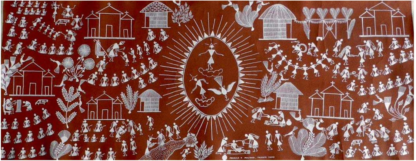
Pintura Warli en Bardipada.

El pueblo Warli es un grupo de adivasis que habita en la zona montañosa y costera de la frontera entre Maharashtra y el sur de Gujerat. De costumbres propias y tradición animista y que además han adoptado costumbres y tradiciones hindúes. Cuentan con un idioma propio, Warli, fruto de la mezcla de los idiomas maratí y gujerati con ciertas influencias locales.