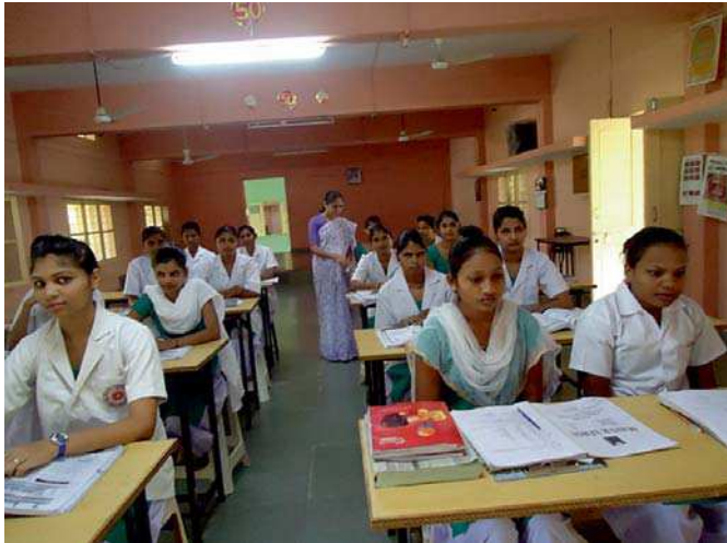
Las jóvenes asisten atentas a todas las formaciones.

El proyecto también incluye un componente de aprendizaje y servicio que se concreta en devolver a su comuni-