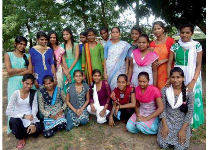
Grupo de alumnas de enfermería de Bhal Vikas Kendra.

La comunidad dalit ha sido históricamente marginada y relegada por esa razón a desempeñar actividades consideradas impuras como la recogida de basuras y otras en las que se entra en contacto con aguas fecales y todo tipo de fluidos. En la cultura hindú los fluidos corporales son considerados contaminantes y, por tanto, tener contacto con esas materias no es digno de ciertos grupos. Resulta curioso como fruto de esta discriminación unas religiosas de Gujerat han encontrado una grieta en el intrincado sistema social que hace que una ocupación relegada a las comunidades más desfavorecidas pueda convertirse a una profesión respetable y bien remunerada: la enfermería. Esta actividad no apta para todas las castas, ya que expone a quien la ejerce al contacto con fluidos corporales como la sangre, representa una importante oportunidad de desarrollo profesional para las mujeres jóvenes dalits.