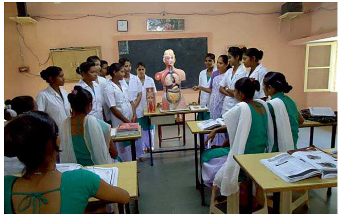
Clase de anatomía para las jóvenes enfermeras.

Una congregación de religiosas está a cargo de la formación de mujeres jóvenes dalits como enfermeras gracias a los fondos proporcionados desde Misión de Gujerat-ALBOAN. En la localidad de Dholka, en el distrito de Ahmedabad, existe una comunidad compuesta por cuatro religiosas que atiende en la residencia-internado Bhal Vikas Kendra a chicas dalits que estudian para convertirse en enfermeras. Se trata de un grupo de diecinueve alumnas, de entre 17 y 18 años de edad, procedentes de poblaciones cercanas que siguen un programa de formación teórica de seis meses de duración. Tras la formación teórica completan el programa participando en un programa de prácticas que llevan a cabo durante cuatro meses en el hospital de la localidad. Tras