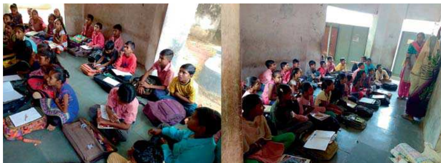
Las clases de recuperación complementan la formación que reciben los niños y niñas de la zona.

“Estaba convencido de que Matruchhaya trabaja en zonas remotas, lejos de la capital y de Ahmedabad. Sin embargo, pronto me di cuenta de que Balasinor, en el distrito de Kherda, no dista mucho de Gandhinagar, Ahmedabad, Baroda y otras ciudades de los alrededores. Llegamos a Balasinor muy rápidamente, ya que