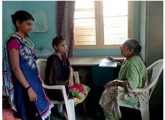
La formación incluye tutorías personalizadas.

dad parte de lo aprendido para lo que las monjas animan a las chicas a realizar actividades de sensibilización sobre temas sanitarios en las escuelas de sus poblados de origen. Dichas actividades consisten en representaciones artísticas y teatrales que les ayudan a introducir mensajes sensibilizadores sobre cuestiones de salud pública y privada tan delicadas como la prevención del SIDA.